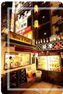
คาเฟ่กลางแจ้ง ย่านชินจูกุ

คอฟฟี่ช็อป (喫茶店 : คิสสะเตน) คนญี่ปุ่นนิยมนั่งดื่มชากาแฟ และกินขนมเค้ก ทำให้มีร้านประเภทนี้มากมาย ทั้งบรรยากาศดี นั่งได้นาน แล้วขนมเค้กก็หน้าตาน่ากินมาก เห็นแล้วอยากนั่งกินทั้งวัน ไม่อยากไปไหนต่อเลย แนะนำให้ลองหาโอกาสเข้าคอฟฟี่ช็อปหรือร้านเบเกอรี่สไตล์ญี่ปุ่นดูสักครั้ง เพราะเขาทำขนมเค้กสารพัดชนิดได้อร่อยมากจริง ๆ ทั้งนุ่ม เนียน เบาหวานน้อย และละลายในปาก