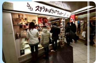
'ร้านคุกกี้ของคุณปัสเตลล่า' ขายคุกกี้นานาชาติ